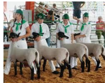
Participando en the Shasta County 4-H program exhibit their project lambs at the Shasta District Fair.

Las ferias ofrecen oportunidades para que los miembros exhiban sus proyectos del año pasado y se den cuenta de cómo han desarrollado sus habilidades. Las ferias también son el lugar donde los miembros de 4-H comparten con la comunidad las actividades de su club. Cada feria se rige por un conjunto de normas que deben ser revisadas cuidadosamente por el personal de UC 4-H. La mayoría de las ferias no son dirigidas por UC 4-H. Registrar los proyectos de UC 4-H en ferias del condado, distrito, y estado es responsabilidad de los miembros de UC 4-H. Los miembros 4-H deben contactar a su líderes de proyecto para obtener los formatos necesarios, para que los ayuden a completar formularios, y a incluir las firmas que se requieren. Los miembros son responsables por entregar sus formatos a tiempo. Es la responsabilidad de los miembros saber las normas y seguirlas, mientras representen a UC 4-H, siguiendo el código de conducta de UC 4-H.